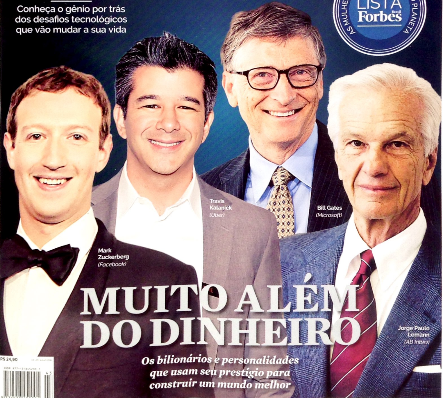
Mark Zuckerberg (Facebook)