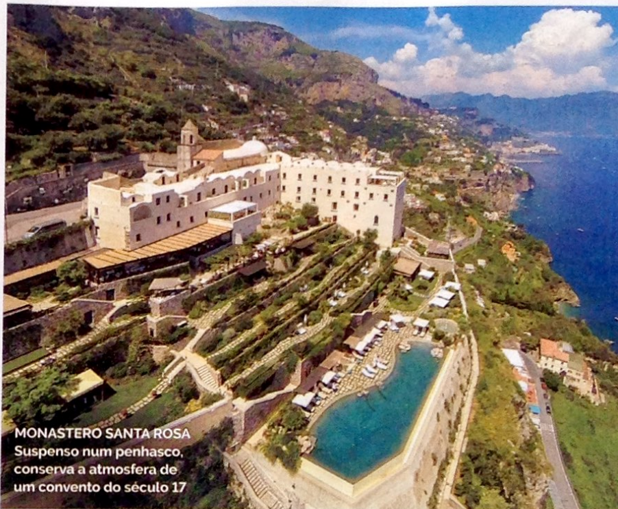
MONASTERO SANTA ROSA Suspenso num penhasco, conserva a atmosfera de um convento do século 17

Não perca Vá jantar no restaurante Lido Azzuro, em Amalfi — a comida é divina, e o ambiente, superagradável, num belo terraço. Faça um passeio de barco e pare para almoçar no Da Adolfo.