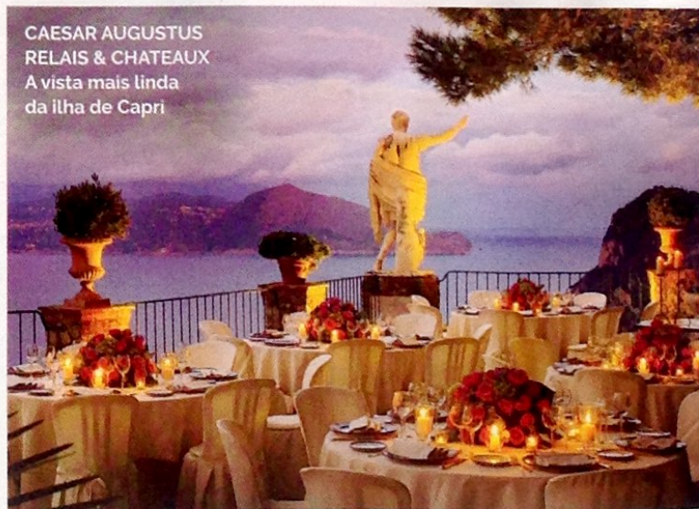
CAESAR AUGUSTUS RELAIS & CHATEAUX A vista mais linda da ilha de Capri