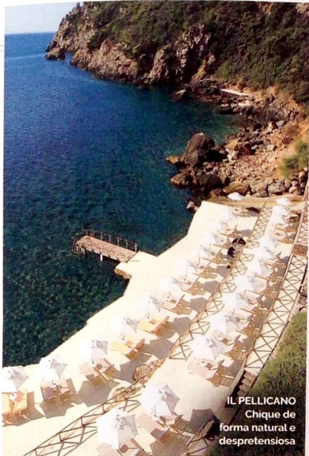
IL PELLICANO Chique de forma natural e despretensiosa